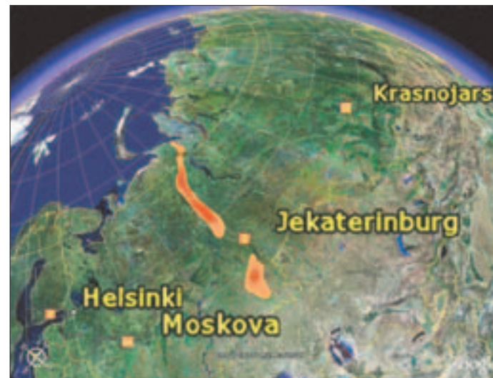
■ Krasnojarsk on noin 3500 km:n etäisyydellä Rovaniemeltä.

Mieleeni tulevat napapiirillä samaan tapaan käyttäytyvät turistit. Naurattaa. Kuvaamista, kädenpuristuksia ja halailua Euroopasta Aasiaan ja päinvastoin ja tietyt virallisen delegaatiokuva. Yritämme vakavoitua kuvassa, mutta sitä häiritsevät yhteinen huumorittomuus ja paikalla lounastaneen