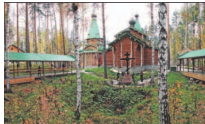
■ Venäjän keisariperhe päätyi tähän kaivosalueen kuoppaan 1918.

koululaisryhmän iloisesti bussista vilkuttavat lapset.